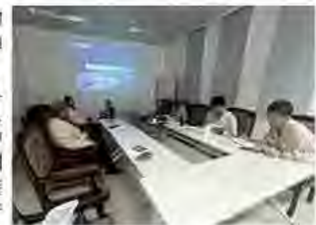
常婷婷 / 销售部

交流过程中，公司业务人员向客户介绍了企业发展规划、产品优势等情况，收集了客户提出的意见和建议，并到惠州石化现场进行了参观，了解装置生产与产品需求情况，为产品销售和服务奠定坚实基础。